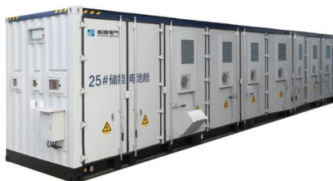
コンテナ産業用蓄電池システム