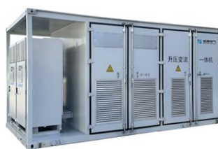
産業用エネルギー貯蔵システム